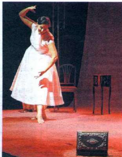
► Poesia e encanto no solo 'Bailarina'

ONDE: Espaço Sobrevento. R. Cel. Bairão, 42, Bresser, 3399-3589, metrô Bresser. QUANDO: sáb. e dom., 11h. QUANTO: Grátis. Até 18/12. Rec.: até 3 anos, 30 min.