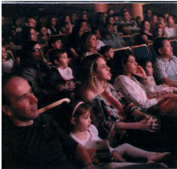
Teatro Alfa: até dez crianças de colo na plateia por sessão